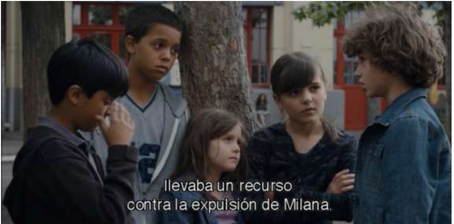
llevaba un recurso contra la expulsión de Milana.